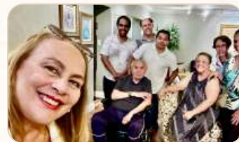
Grupo dos Dois Sagrados Corações, Asa Sul-Brasília.