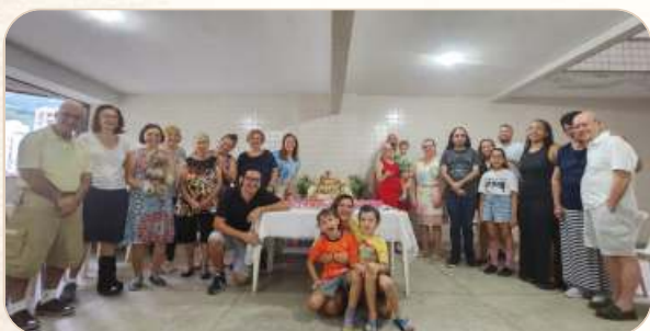
O Grupo do Rio de Janeiro, junto ao presépio, no Terço das Rosas. Nos mistérios do terço, contemplaram a Peregrinação ao Corpo de Jesus de AVVD.