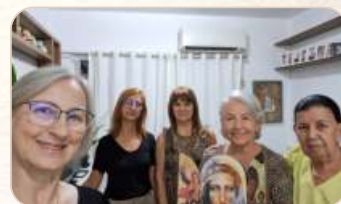
G.O. de Joinville: "flores do Jardim do Senhor".