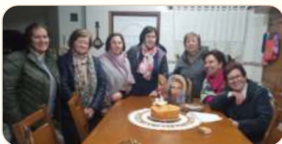
O Grupo de Oração de Castro Daire, Portugal, celebrou os 7 anos da sua formação.