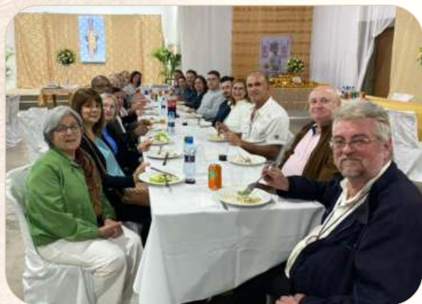
O Grupo de Oração de Joinville-SC comemorou o aniversário de 30 anos de Sagração Episcopal do Arcebispo Ortodoxo da América Latina, Dom Jeremias Ferens.